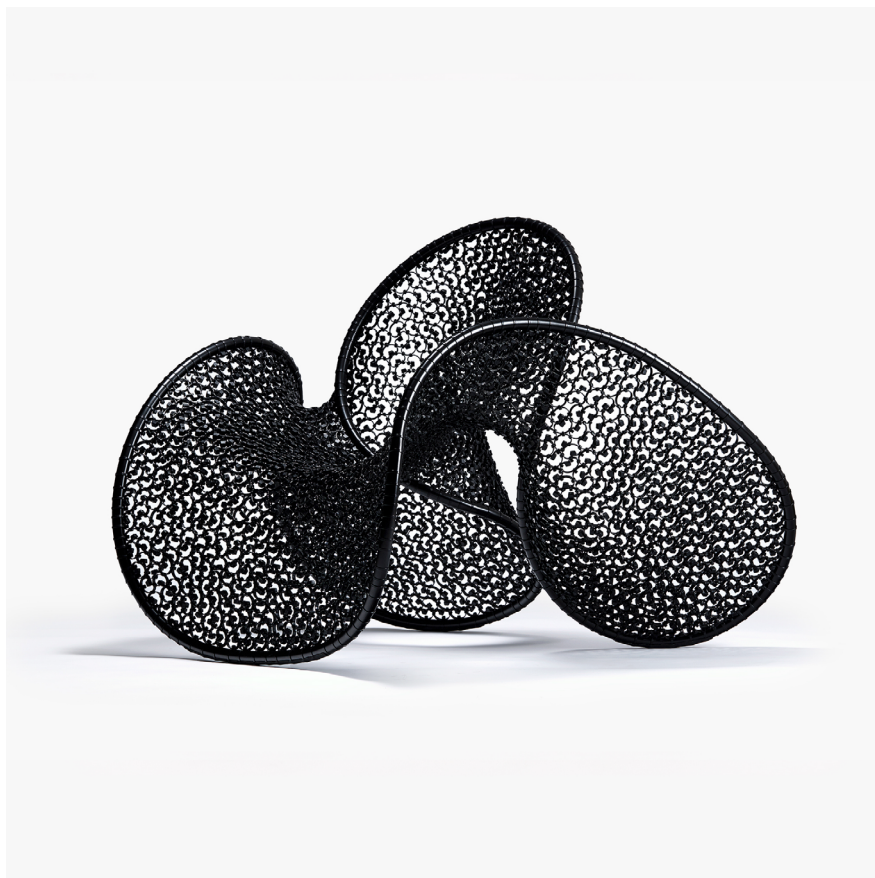
KIM YOO JUNG Single chair 2017 Nylon, Steel 110×125xH94cm