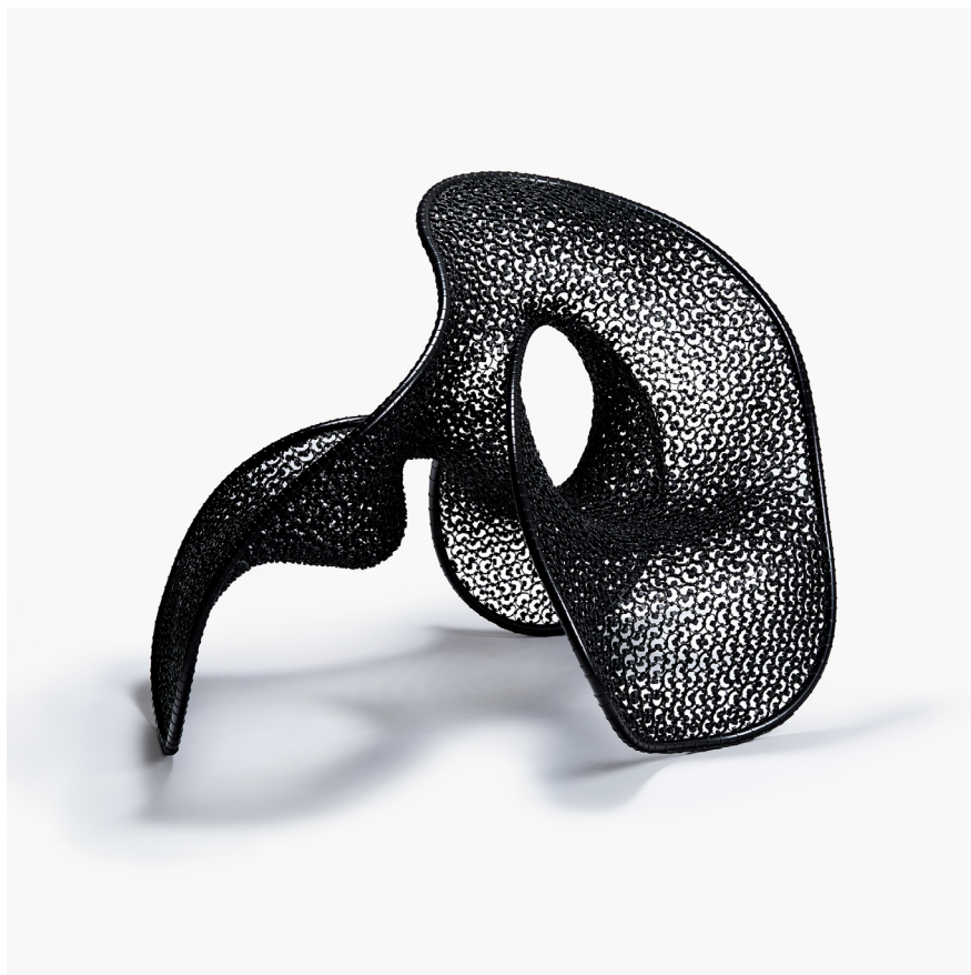
KIM YOO JUNG Two seater chair 2017 Nylon, Steel 125×125xH111cm