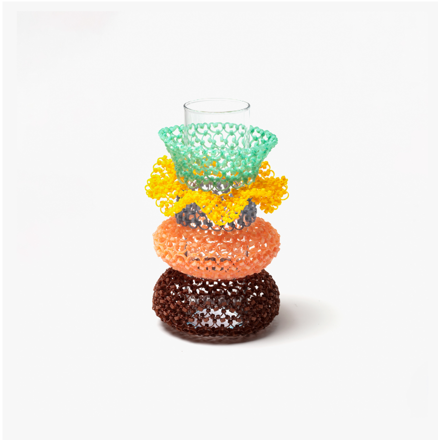
KIM YOO JUNG Bespoke vase 2021 Nylon, Glass 17×17×27cm

고화질 이미지는 별도 첨부합니다. 보도자료 내 모든 이미지는 작품 정보 및 저작권 정보를 함께 명기해주시기를 부탁드립니다. Please specify the work information and copyright information for all images in the press release.