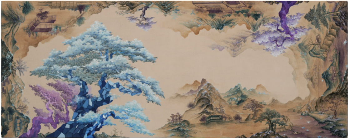
손찬희 이음(1) 2021 흙판, 분채, 먹 65×170cm