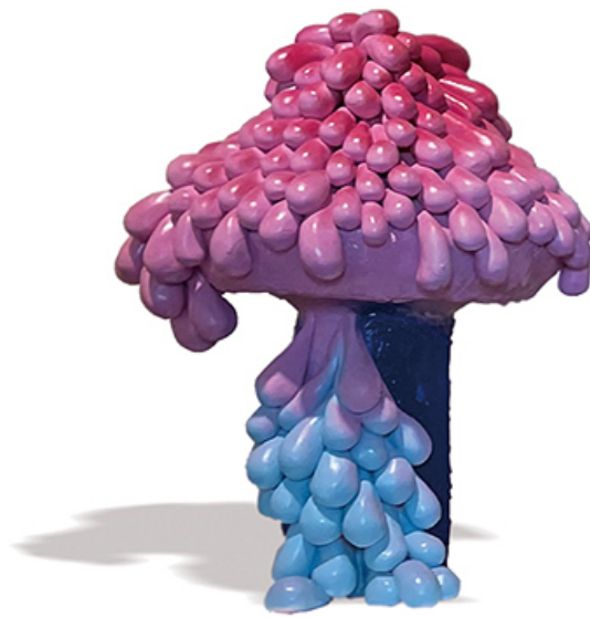
윤지영 Mushroom-1 2021 FRP, Graffiti paint 30×28×51cm